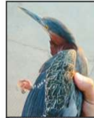
AVES SE QUIDARON SIN HOGAR.