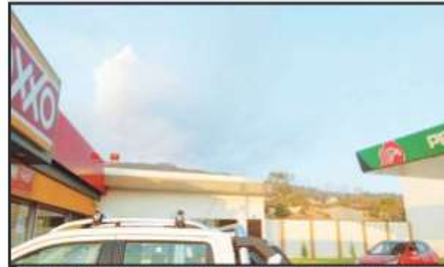
SE TEME INCLUSO QUE LAS LLAMAS LLEGUEN EN BREVE A ZONA URBANA.

árboles afectados por el fuego en Los Reyes