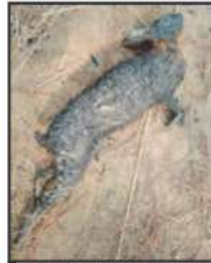
MUCHOS ANIMALITOS, ATRAPADOS.