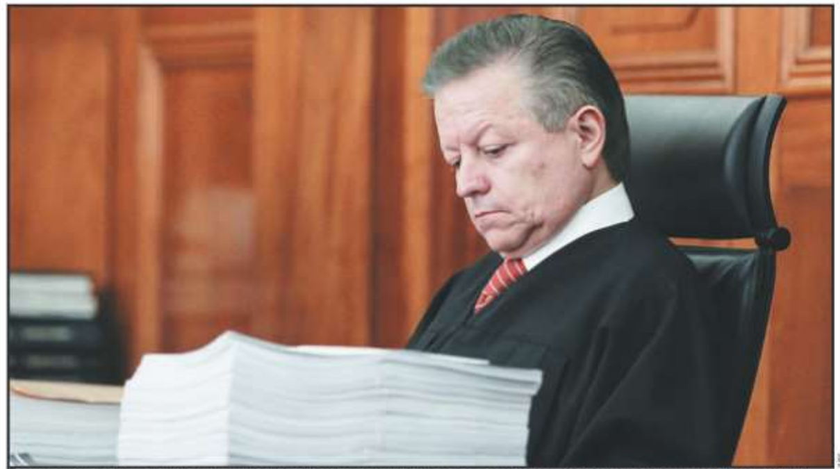
LA REFORMA AL PODER JUDICIAL DE LA FEDERACIÓN, INCLUYE UN ARTÍCULO QUE AMPLIA 2 AÑOS MÁS EL MANDATO DEL MINISTRO ZALDÍVAR EN LA SCJN.

Ciudad de México.- El Senado aprobó ayer jueves leyes y reformas que buscan reestructurar la organización y funcionamiento del Poder Judicial, con las que se pretende combatir el nepotismo y la corrupción, pero incluyó de última hora un artículo que amplía el mandato del presidente de la Suprema Corte de Justicia de la Nación (SCJN), Arturo Zaldívar, por dos años.