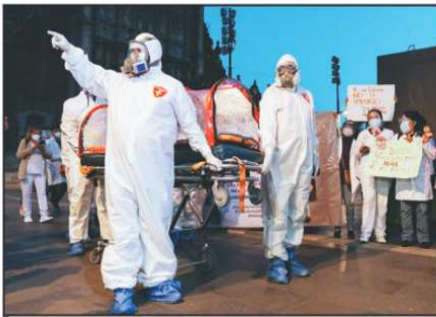
TRAS VARIAS MANIFESTACIONES, EMPLEADOS DE HOSPITALES PARTICULARES SERÁN VACUNADOS ANTES DE 48 HORAS.