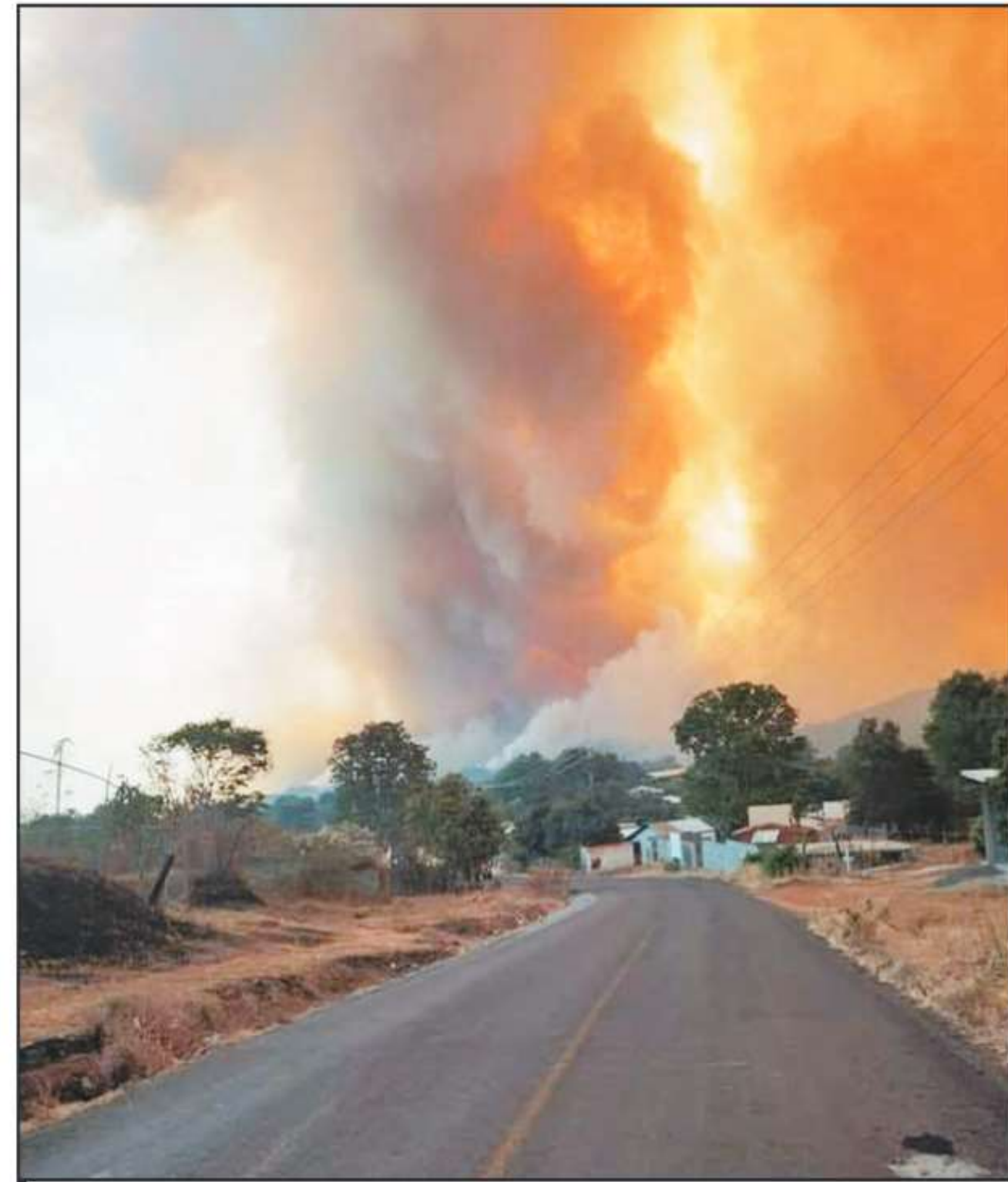
AUNQUE VECINOS DEL LUGAR SEÑALAN QUE HA HABIDO SINIESTROS IMPACTANTES EN OTROS TIEMPOS, POCOS SE LE COMPARAN AL REGISTRADO EN ESTOS DÍAS.

Los incendios han escalado. En menos de 10 días, tres incendios pusieron en jaque las acciones institucionales para contener el fuego que, en muchos casos, se presume son causa del cambio ilegal de uso de suelo. Cabe señalar que para el caso de Los Reyes se desplazaron 50 elementos castrenses de caballería y se espera otro grupo de refuerzo del 17 Batallón de Infantería, grupos que refirieron, se han estado destacando en las zonas afectadas.