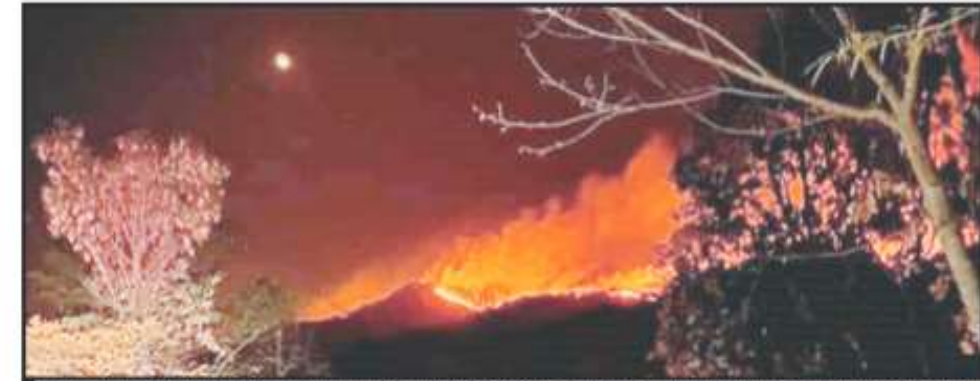
AL CAER LA NOCHE SE PODÍA ApreciAR UN ESCENARIO IMPACTANTE, SE DESATÓ EL INFIERNO EN LOS REYES, DICIAN VECINOS.