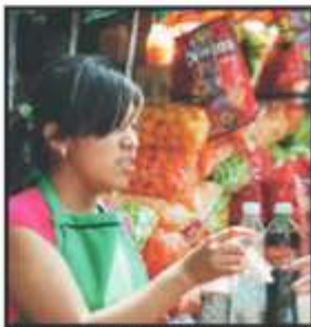
REVISAN PRODUCTOS CHATARRA.

La Comisión de Educación de la Cámara de Diputados aprobó una minuta para que la Secretaría de Educación (SEP) prohíba la venta de productos chatarra en las escuelas e inmediaciones.