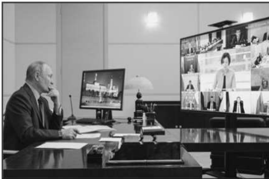
AUNQUE LO TOMÓ CON TODA TRANQUILIDAD, VLADIMIR PUTIN BUSCA ATENUAR LA SANCIÓN CON JOE BIDEN.

EUA ha sancionado, además, a seis empresas tecnológicas de Rusia a las que acusa de apoyar a la Inteligencia de ese país.