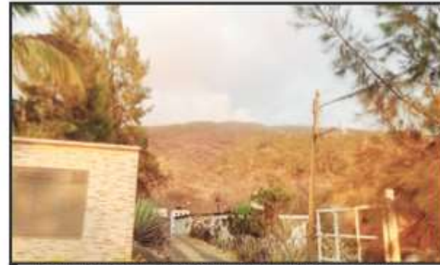
LA CONFLAGRACIÓN EN LOS REYES HA SIDO LA MÁS GRANDE DEL AÑO.